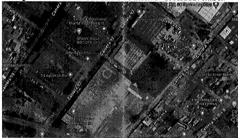
Figura 5 Ubicación IDIGER Centro de Reserva – Localidad Fonlibón